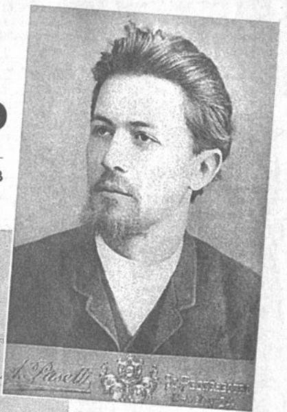
А.П. Чехов, 1888 г.

В ИТОГЕ получилась большая, прекрасно оформленная книга под названием «Быть может, и пригодятся мои цифры... Материалы сахалинской переписи А.П. Чехова. 1890 г.». Макет был подготовлен к печати издательством «Рубеж», а 1000 экз. тиража