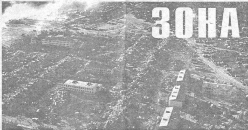
Первые дни после трагедии

Нефтегорск. Четыре с лишним года назад этот поселок нефтяников на севере Сахалина стал печально известен на весь мир. После землетрясения 28 мая 1995 года Нефтегорска не стало. Из четырех тысяч жителей осталась половина. Остальные остались погребенными под развалинами.