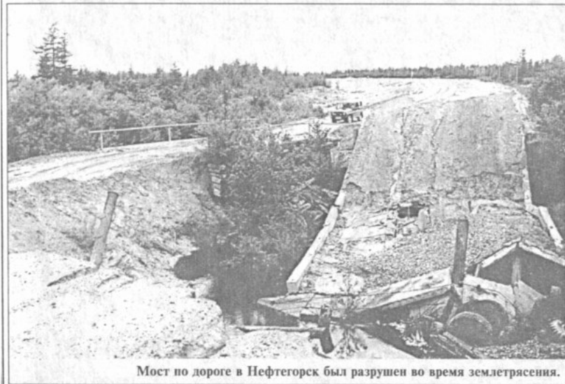
Мост по дороге в Нефтегорск был разрушен во время землетрясения.