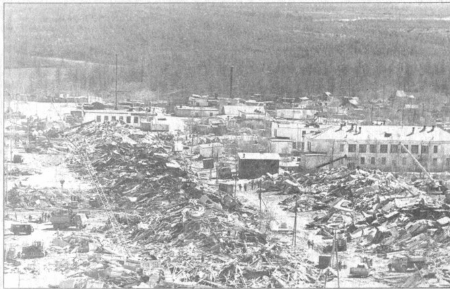
Таким стал Нефтегорск после землетрясения 28 мая 1995 года.

Катастрофа нанесла огромный ущерб и экономике Сахалинской области, в первую очередь нефтегазовым предприятиям «Сахалинморнефтегаза». Вот информация на утро после землетрясения: «Повреждено 275 км магистрального и промышленного нефтепроводов, нефтеперекачи-