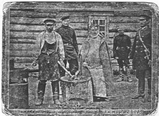
Заковка Золотой Ручки. Местный фотограф, продавая фото туристам, скапотил капитал.

Но я уверена, что каторгу на Сахалине отбывала настоящая Софья Блювштейн, а никакой не двойник. Миф о двойнике скорее всего был вызван созданным прессой того времени образом Соньки – обольстительно-красивой, образованной светской дамы, несоответствие которой явно вырисовывается в сравнении с сахалинской Сонькой. Сдается мне, что все было намного проще. Оружием Соньки была обыкновенная женская сексуальность, а жертвами ее становились исключительно Большие Люди, которые, безусловно, не могли же повестись на обычную простушку, вот и придали ей образованности да светскости. А когда с увяданием молодости красота и сексуальность ее померкли, стало ясно, что образованность и светскостью там и не пахло. Да и откуда им было взяться? С малолетства Сонька занималась воровством, университетов не заканчивала.