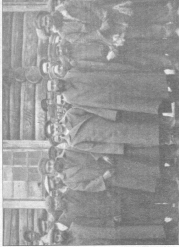
Александровская каторжная тюрьма. 1894 г.